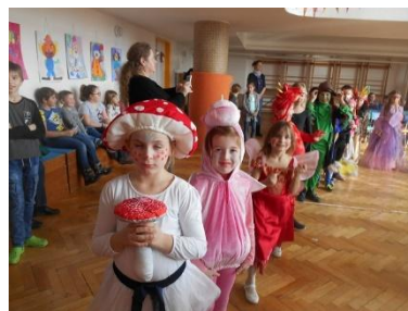
Karneval ve školní družině